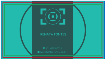
Página 03 (Impressão Verso)