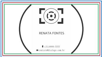
Página 04 (Verniz do Verso) Obs.: 100% de preto(k) em vetor